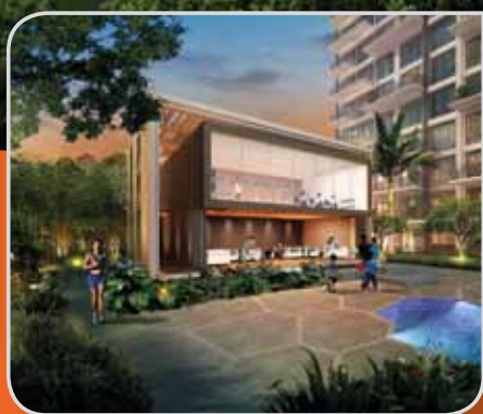
康乐俱乐部健身房 和宴客套房