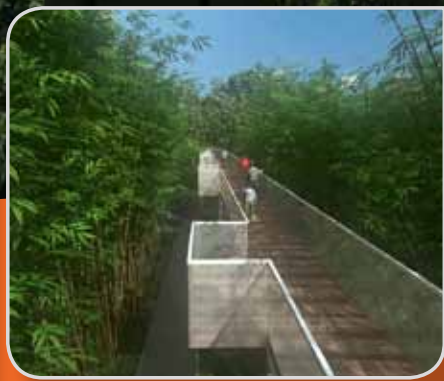
度假屋风格的 园艺美化