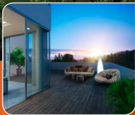
空中套房和 阁楼单位